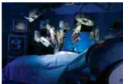
Chirurghi robot a Firenze: trapianto renale all'ospedale Careggi

L'intera procedura è durata quattro ore. Tre le fasi in cui è stata organizzata la procedura: prelievo del rene, sua preparazione su banco e, infine, trapianto. Questo ha consentito di risparmiare un'ora di tempo , riducendo al minimo i minuti in cui il rene non ha ricevuto ossigeno dalla circolazione sanguigna.