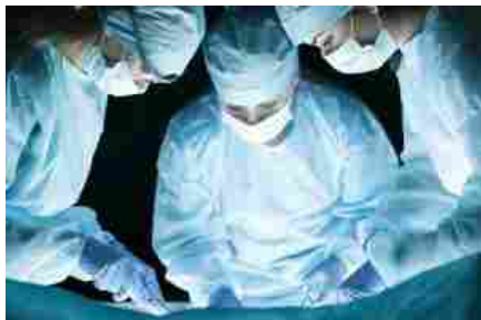
Primo trapianto reni a tempo record in Italia

L'utilizzo del robot nel trapianto renale rappresenta una metodica altamente innovativa che consente di ridurre al minimo i giorni di degenza post operatoria grazie a una incisione di soli sei centimetri, tre volte più piccola rispetto alla chirurgia tradizionale.