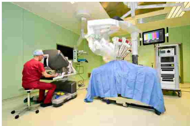
Il robot operatorio Da Vinci in funzione all'ospedale all'Angelo

MESTRE. L'Asl Serenissima lo considera il "gioiello" della sanità veneziana. È il Robot Operatorio Da Vinci, sempre più utilizzato per interventi di altissima precisione all'ospedale all'Angelo, utilizzato non solo dai chirurghi di Mestre e Venezia, ma anche dalle équipe operatorie degli ospedali di Dolo e di Chioggia: quattro bracci operativi per la gestione di strumenti e telecamera, di laser di puntamento, di touchpad di controllo, un "carrello visione", con monitor touchscreen 24" ad alta definizione, collegato attraverso cavi in fibra ottica, gestisce tutte le funzioni visive: "Minore invasività, minor sanguinamento, minori tempi di recupero dei pazienti", sottolinea il direttore generale Giuseppe Dal Ben